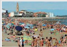
La spiaggia di Caorle (archivio)