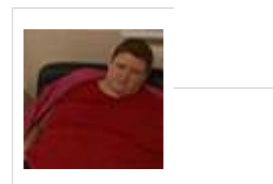
Il killer del grasso! Questo ingrediente fa