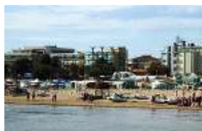
Hotel di Rimini in rivolta per le recensioni pazze