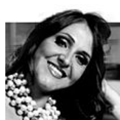
Tradisco perché mi va. Punto