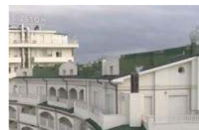
"Tre stelle in contanti", in un documentario l'assalto della mafia agli hotel de...