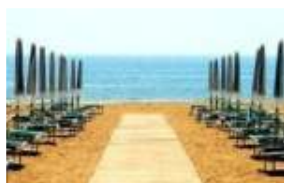
Terremoto, paura dei turisti stranieri per la Riviera. Il ministro Gnudi: "Tutte..."