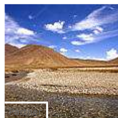
I 5 luoghi più silenziosi e rilassanti del mondo (topfive.it)