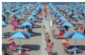
Stabilimenti balneari, la casta è salva. Il governo: "Niente asta, aumentano i c..."