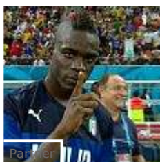
Balotelli zittisce tutti, il giorno dopo sui social network