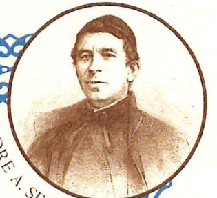
PADRE A. SECCHI