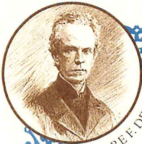
PADRE F. DENZA